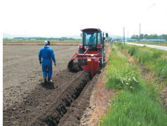
写真1 表面排水はミゾ掘りで

なお、抜本的な対策としての暗きょ施工ですが、その効果を十分に発揮させるには、土壌が過湿状態での施工は避けること、埋め戻し土はできるだけ乾燥させること、作業機による過剰な踏み固めを回避すること、などの点に留意する必要があります。