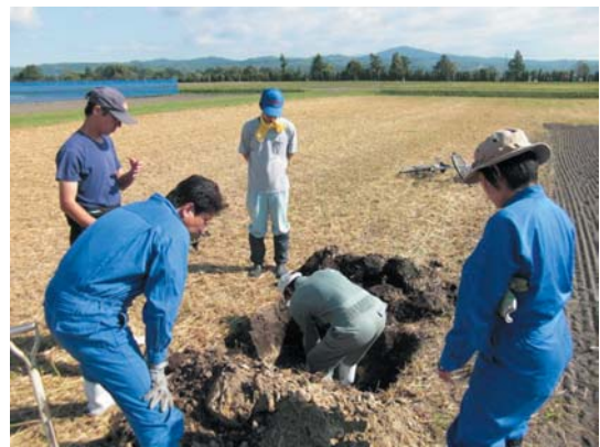
写真3 土壌診断を行い施肥設計に活用しましょう

前に土壌を採取し、分析機関に依頼します。なお、土壌分析値は、変化の大きい無機態窒素を除けば、通常3～4年程度継続して利用することが可能ですが、大きな幅の減肥対応や有機物を多量施用した場合には土壌診断の頻度を高めます。北海道施肥ガイド2010を活用した施肥設計の詳細は、お近くの農業改良普及センターなどにお問い合わせ下さい。