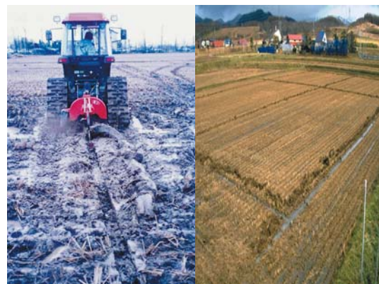
写真1 表面排水はミゾ掘りで

なお、抜本的な対策としての暗きよ施工ですが、その効果を十分に発揮させるには、土壌が過湿状態での施工は避けること、埋め戻し土はできるだけ乾燥させること、作業機による過剰な踏み固めを回避すること、などの点に留意する必要があります。