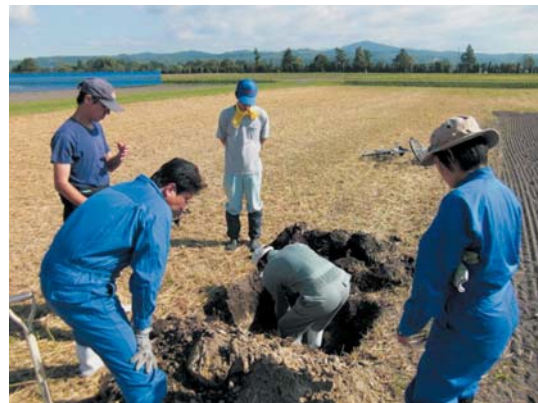
写真3 土壌診断を行い施肥設計に活用しましょう

素を除けば、通常3～4年程度継続して利用することが可能ですが、大きな幅の減肥対応や有機物を多量施用した場合には土壌診断の頻度を高めます。北海道施肥ガイド2010を活用した施肥設計の詳細は、お近くの農業改良普及センターなどにお問い合わせ下さい。