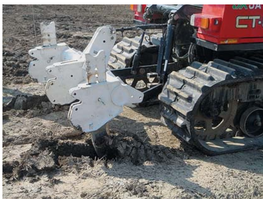
図1 サブソイラの施工

越冬後の個体数が150個体/m 2 以下では、収量が低下する傾向が見られ、200~250個体/m 2 で収量が安定する傾向が見られます。300個体以上では、過繁茂になりやすく、必ずし