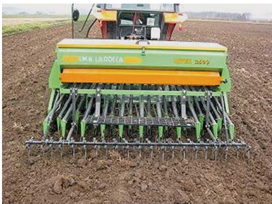
図 3 グレンドリルは種