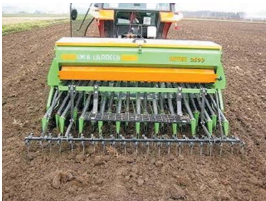
写真5 グレンドリルは種

は種方法は、グレンドリル等による条播（写真5）と、ミスト機やチゼルプラウシダ等による散播に大別されます（表1）。