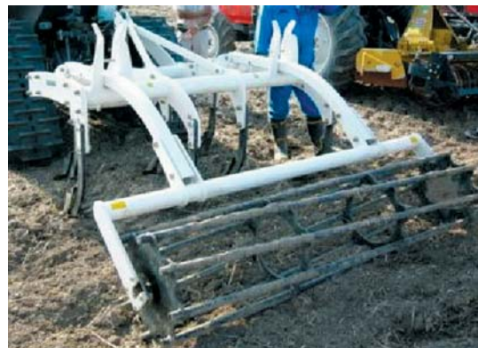
写真3 スタブルカルチ施工