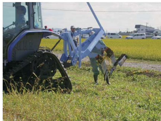
写真1 穿孔暗きょ施工機の外観