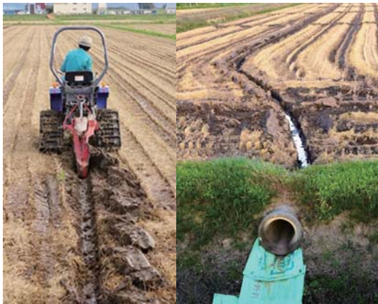
写真2 表面排水はミゾ掘りで

ること、埋め戻し土はできるだけ乾燥させること、作業機による過剰な踏み固めを回避することなどの点に留意する必要があります。