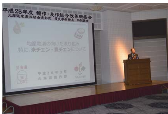
平成25年度 稲作・麦作総合改善研修会