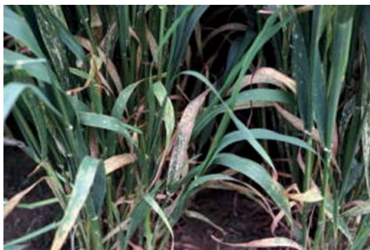
写真8 下葉から上部へ伸展するうどんこ病菌