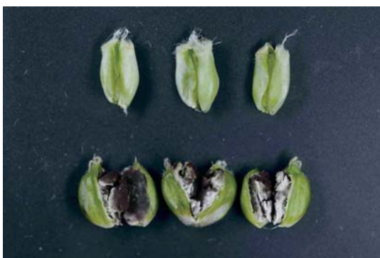
写真4 乳熟初期にはすでに胞子が充満し生臭い

昨年までの感染状況で、発生に気づかずに土壌伝染により拡大した事例が多いことから、初発の確認が重要である。