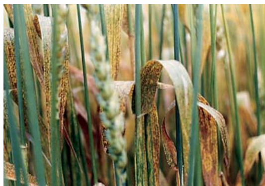
写真9 葉に発生した赤さび病菌