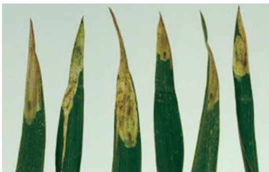
写真11 幼虫による被害(袋状に食害する)

秋まき小麦は生育ステージが進んでいることから、減収に結びつく被害はないと思われるが、春まき小麦については6月中～下旬の被害が懸念される。幼虫が葉先から中央部へ向かって葉肉内を幅広く潜り、袋状の食害痕を形成する（写真11）。近年では平成17、18、23年に発生が目立った。止葉を含む上位2葉の被害葉率（被害が葉身の1/2程度に至った葉数割合）が秋まき小麦で16%、春まき小麦では12%を超える場合薬剤防除が必要となる。