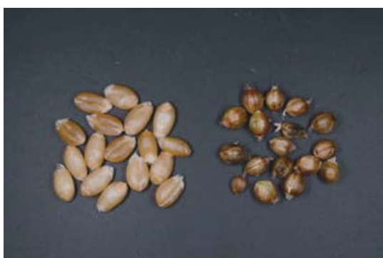
写真6 左：正常子実 右：罹病子実