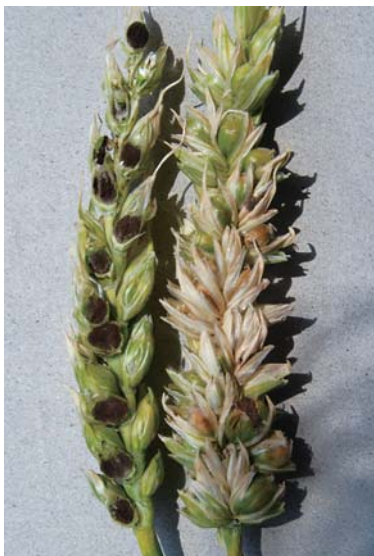
写真1 なまぐさ黒穂病に罹病した穂 「左：穂を縦割りにしたもの」

本病の防除対策については、未だ確立されておらず、初発生の段階では場内封じ込めが必要であり、病原菌をほ場外に持ち出さないことが重要である。