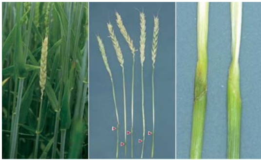
写真10 白穂（左、中）と食害痕（右）