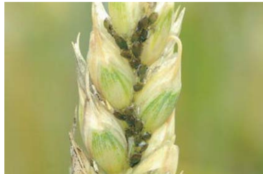
写真12 穂に寄生したアブラムシ