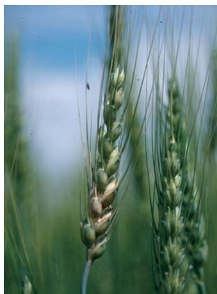
写真7 赤かび病罹病穂 (春まき小麦)

このため生産場面においては、赤かび粒の混入は0.0%（10,000粒に4粒以内）、DON