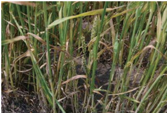
写真3 穂は丈は低いが剛直