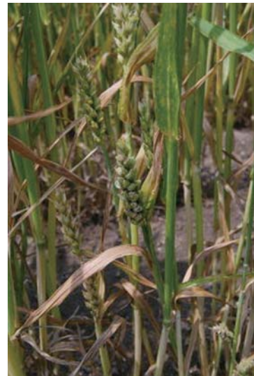
写真5 胞子が充満して黒く見える穂