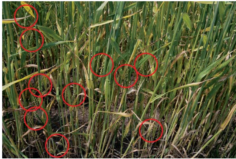
写真2 ほ場で発生を確認するためにはコンバイン入口などの丈の低い穂（赤丸）を確認する