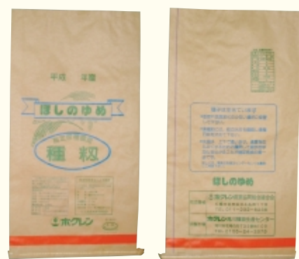
ほしのゆめ (ローズ)