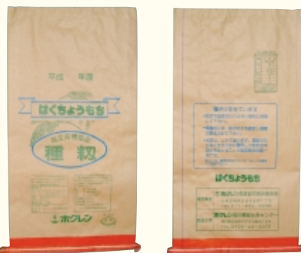
はくちょうもち (赤)