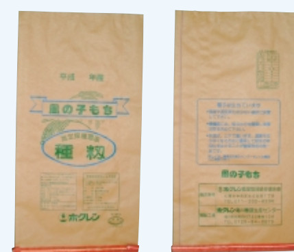
風の子もち (クレープ赤)