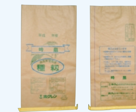
吟風 (クレープ黄色)