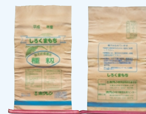
しろくまもち (帯青色クレープ赤)

浸種作業の際についても、異品種混入防止の為、荷札をつけるなど取りちがいのない様十分注意願います。