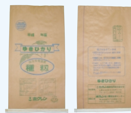
ゆきひかり (クレープ白)