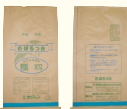
おぼろづき (浅葱色)