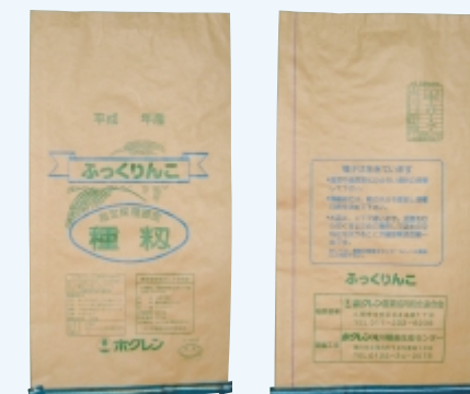
ふっくりんこ (クレープ青)