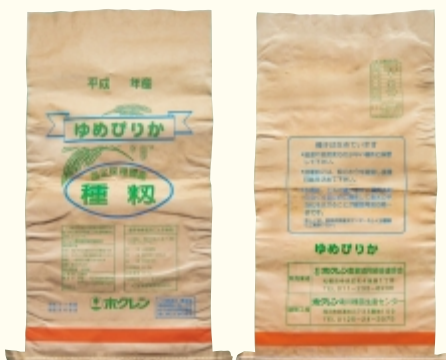
ゆめぴりか (オレンジ)